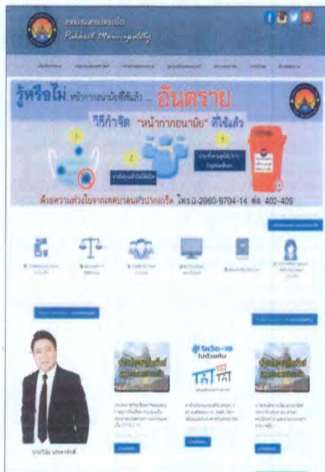
การประชาสัมพันธ์ทางเว็บไซต์เทศบาล